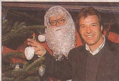
Ja, es weihnachtet schon sehr: Der Weihnachtsmann mit Sänger Patrick Lindner.